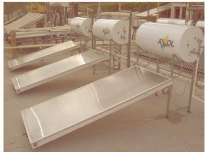
Imagen del producto ensayado en el laboratorio